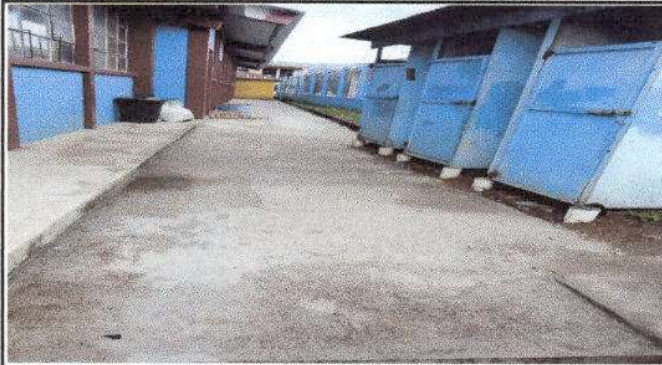
Foto1: Sustrucción de piso de torta de concreto